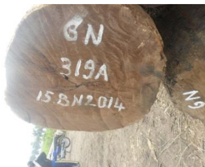
Photo 10. Marquage non conforme

Au parc Beach, l'équipe a dénombré 55 Wenge et 1 Iroko sur lesquels le sigle de l'exploitant est marqué à la peinture alors que les termes de l'arrêté 035/2006 10 recommandent que le sigle de l'exploitant soit inscrit sur le bois exploité au moyen d'un marteau en fer pour les exploitants industriels. L'OI a aussi relevé la non-identification du chantier d'origine dans le marquage fait par la société NBK.