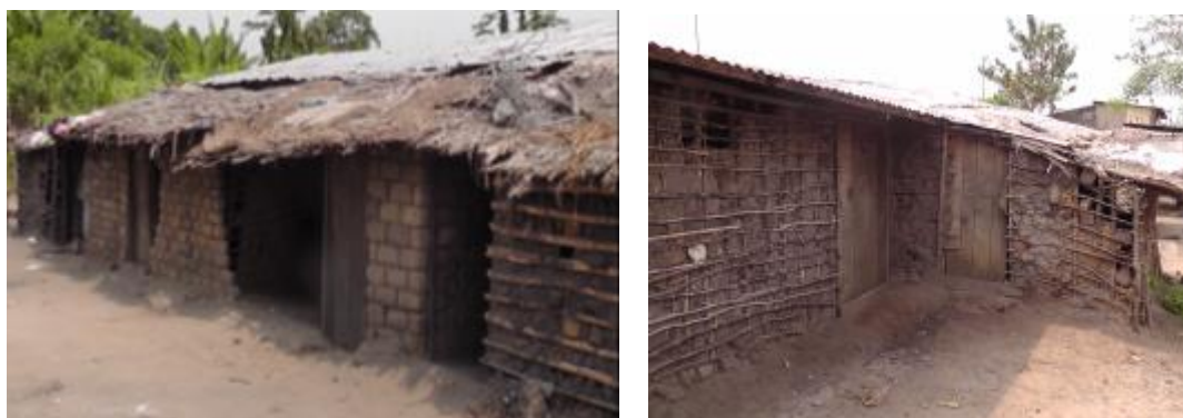
Photo 1. Base- vie des travailleurs de RIBA CONGO