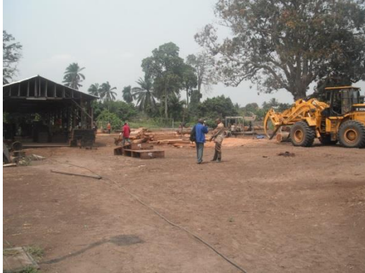
Photo 6. Scierie Vega et billes de bois destinés au sciage