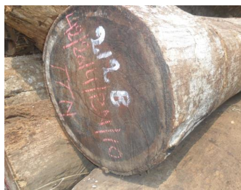
Tableau 4. Liste des billes marquées à la peinture et à la craie