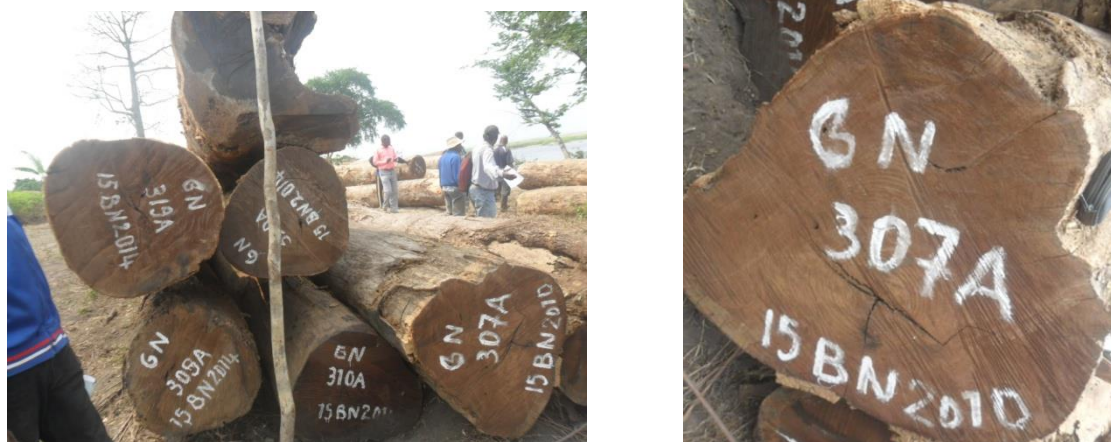
Photo 11. Marquage frauduleux

15/BN/2014, le premier n'étant plus d'actualité. L'OI note donc que la société NBK a procédé à un marquage frauduleux des grumes abattues.