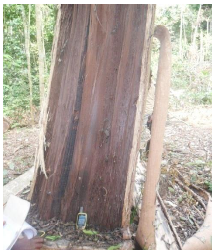
Photo 7. Arbre endommagé (gauche), coupe sur 30% d'inclinaison (droite)

Toutes ces pratiques sont contraires respectivement aux termes des articles 35,42 points 4 et 6, et article 43 de l'arrêté 035/2006 relatif à l'exploitation forestière.