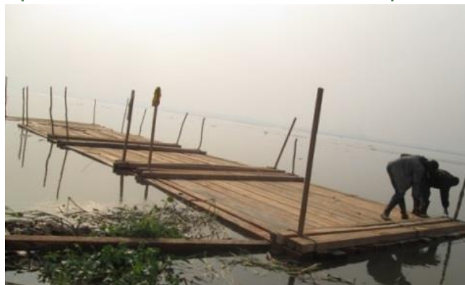
Photo 12. Chargement des planches de M. KULUTUNI G. sur un radeau au port de Kobonzale