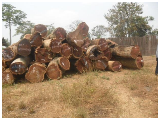
Photo 8. Marquage non conforme des billes

Les billes tronçonnées et fournies à la société Vega avant l'entrée dans la scierie étaient marquées à la craie de tableau et ne portaient pas le numéro du chantier d'origine ainsi que le numéro de la bille dans l'arbre comme le recommande l'article 48 et 49 de l'arrêté 035/2006.