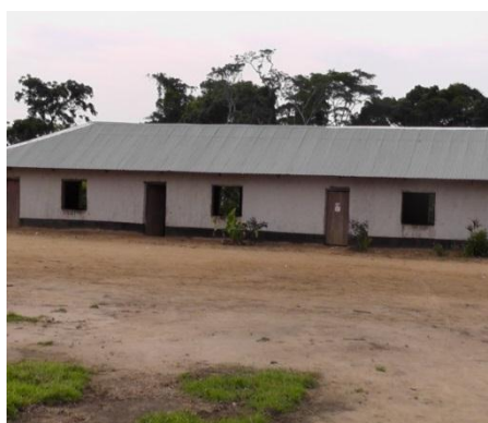
Photo 6 : Ecole primaire au village Ndatiene (à gauche) et l'école secondaire au village Boseki (à droite)

également renseigné la mission que les communautés ont exigé à la société une réfection ou la construction d'écoles dans tous les villages des deux groupements concernés alors que la productivité de leur forêt ne le leur permettait pas. Cette situation a pour conséquence que seul le groupement Mbelo pourra bénéficier du reste d'infrastructures à réaliser parce qu'on y trouve encore des espaces de forêts exploitables.