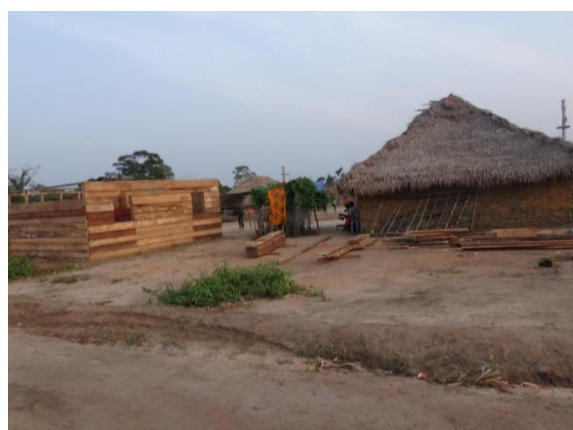
Photo 2 : Base vie de Bankaie en cours d'amélioration et installation sanitaire