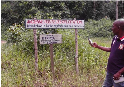
Photo 4 : Non fermeture d'une route (bretelle) au niveau des blocs 35 et 36