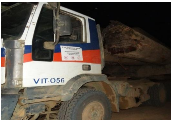
Photo 5. Grumier provenant de la forêt allant vers le parc à grume sans encrage.

Il a été observé en date du 19/02/2015 (vers 18h00'), un grumier transportant 8 grumes sans encrage (câble de protection) venant du lieu de coupe et allant vers le parc beach par l'équipe de la mission. Cette pratique ne sécurise pas les travailleurs commis au transport du bois et expose la population environnante violant ainsi l'article 59 12 de l'arrêté 035/ 2006.