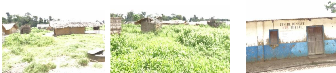
Photo 10 : Base-vie de travailleurs de l'ITB (photos de gauche et du milieu) et centre de santé (photo de droite)