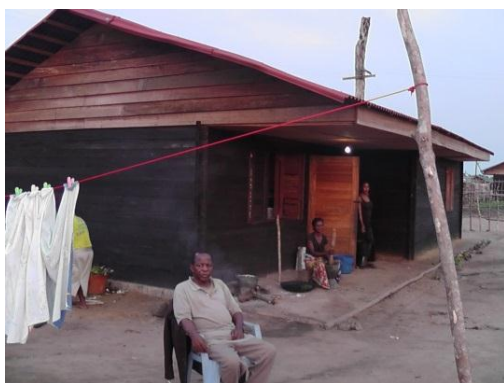
Photo 7 : Bloc de logement de deux travailleurs à Sodefor/ Madjoko et économat