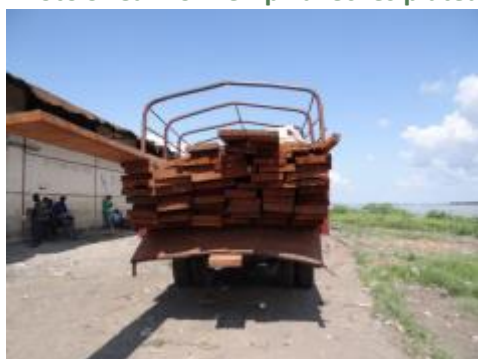
Photo 9. Camion rempli avec les plateaux et bois entreposés au port de CFU

Sur proposition des agents de l'environnement du territoire de Bumba, l'équipe en mission s'est rendu au port de la compagnie des Chemins de Fer de l'Uélé (CFU) où devrait embarquer plus de 600 planches appelés « plateaux » à destination de Kinshasa.