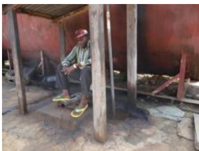
Photo 6. Carburant déversé à même le sol et chenille à déclasser retrouvé dans l'enceinte de SAFO

L'équipe en mission n'a noté aucune mesure prise par la société pour préserver l'environnement dans lequel elle travaille notamment par le fait que le carburant se déverse à même le sol lors du remplissage des réservoirs des différentes machines (véhicules tout terrain, débardeurs, etc.) et l'abandon dans le siège d'exploitation des machines déclassées.