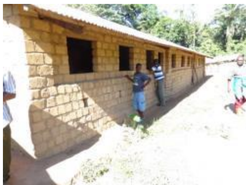
Photo 3. Construction d'écoles au groupement hétérogène et Mongana

De l'analyse des documents soumis à la mission, notamment les décharges signées par les représentants des communautés, il ressort qu'à la date du passage de la mission sur le terrain, les sommes versées pour le préfinancement des travaux de construction d'infrastructures socio-économiques ne représentent que 50% des montants dus au titre d'avance sur les ristournes à verser à la signature des clauses sociales du cahier des charges du contrat de concession forestière 18 . Cette situation n'a donc pas favorisé l'avancement des travaux en bonne et due forme pour les populations des 4 groupements concernés (Hétérogène, Bombatilkele, Bombelelkele et Mongana). Seules deux communautés ont pu commencer les constructions mais qui s'avèrent ne pas être durables. Les deux autres communautés n'ont rien fait d'important avec le montant dérisoire obtenu.