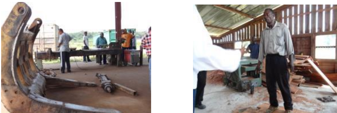
Photo 2. Atelier de maintenance des machines et de menuiserie à SIFORCO/ Engengele

L'équipe de mission a relevé que la SIFORCO dispose de matériaux d'exploitation se situant dans la catégorie 1B des installations classées. Cependant elle n'a pas présenté à la mission les permis d'exploitations de ces installations comme le prévoit l'article 9 alinéa 1 du Décret N°13/015 du 29 mai 2013 portant réglementation des installations classées ; qui dispose :« les installations classées constituant la catégorie I ne peuvent être érigées, transformées, déplacées ou exploitées qu'en vertu d'une autorisation dûment constatée par un permis d'exploitation ».