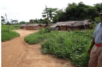
Photo 5. Maison d'habitation (à gauche), installation sanitaire (au milieu), de SAFO (Kubulu) et espace de divertissement

La base-vie des travailleurs installés à Kubulu non loin du siège d'exploitation de la société ne dispose ni de point d'eau potable courante, ni d'installations sanitaires reliées à une fosse septique. Bref la mission a observé des installations non-conformes à la réglementation en vigueur 19 .