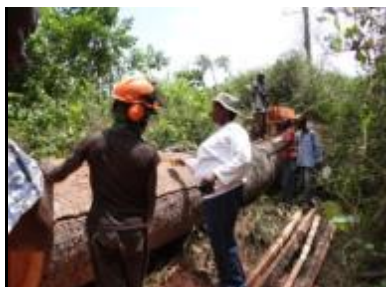
Photo 7. Pied abattu et coordonné géographique