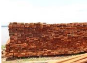
Photo 10. Bois de M. Mwabilwa entreposés au port SCTP en attente d'embarquement