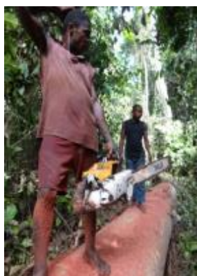
Photo 8. Pied abattu, coordonnée géographique et planches cachées dans la brousse