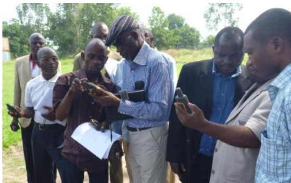
Formation préparatoire aux enquêtes par les OSC départementales, Brazzaville, juin 2011