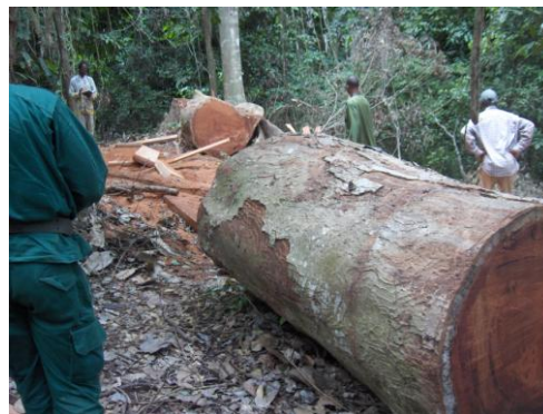
Photos : Souche et arbre abattu