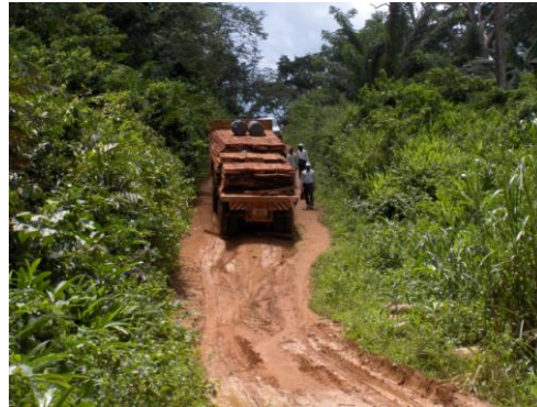
Photo : Bois avec marteau forestier et camion transportant les débités frauduleux

Exploitation non autorisée: La poursuite des investigations par la mission de contrôle a mis en évidence une intense activité d'exploitation forestière non autorisée ou illégale dans les environs du village Beih. Sans avoir un quelconque titre d'exploitation ou permis délivré dans le coin, une longue piste d'exploitation a été ouverte et une dizaine de souches d'arbres abattus et transformés en débités ainsi que le montre la carte et les photos suivantes :