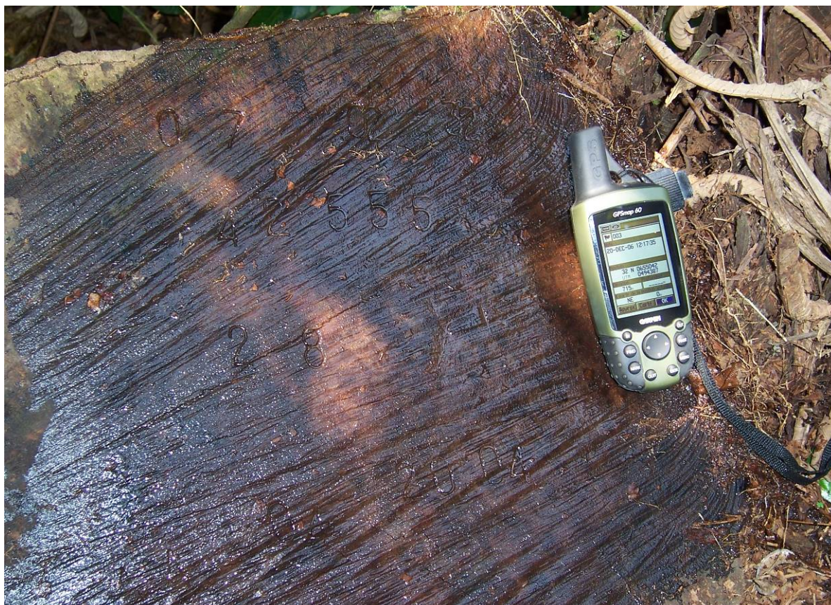
Photo 1, 2 et 3 : Souches et grume portant les marques de la VC 07 02 32