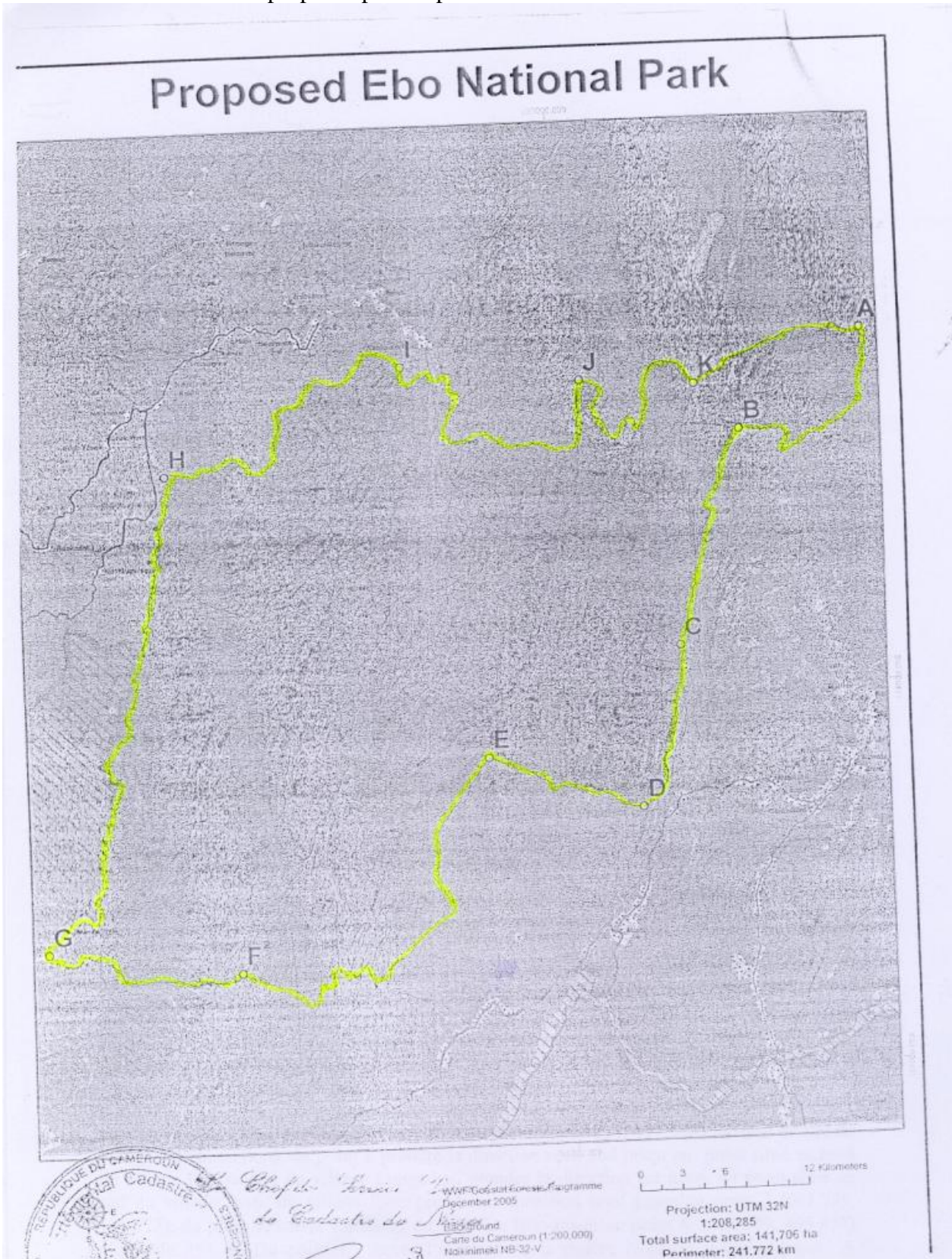
Annexe 1: carte de la zone proposée pour le parc national d'Ebo