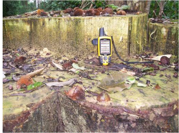
Photo 1 et 2 : Souches d'aningré et d'essesang abattus à l'intérieur de la forêt communautaire