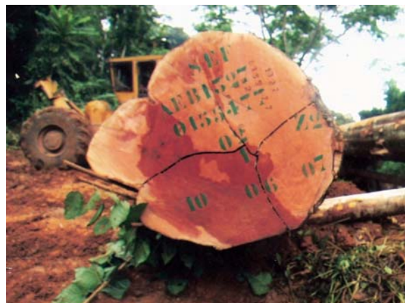
Photo 4 : Photo prise par la communauté lors du chargement des grumes : (Marques de l'ARB 1327 sur des bois trouvés au sein de la forêt communautaire du GIC COVIMOF)