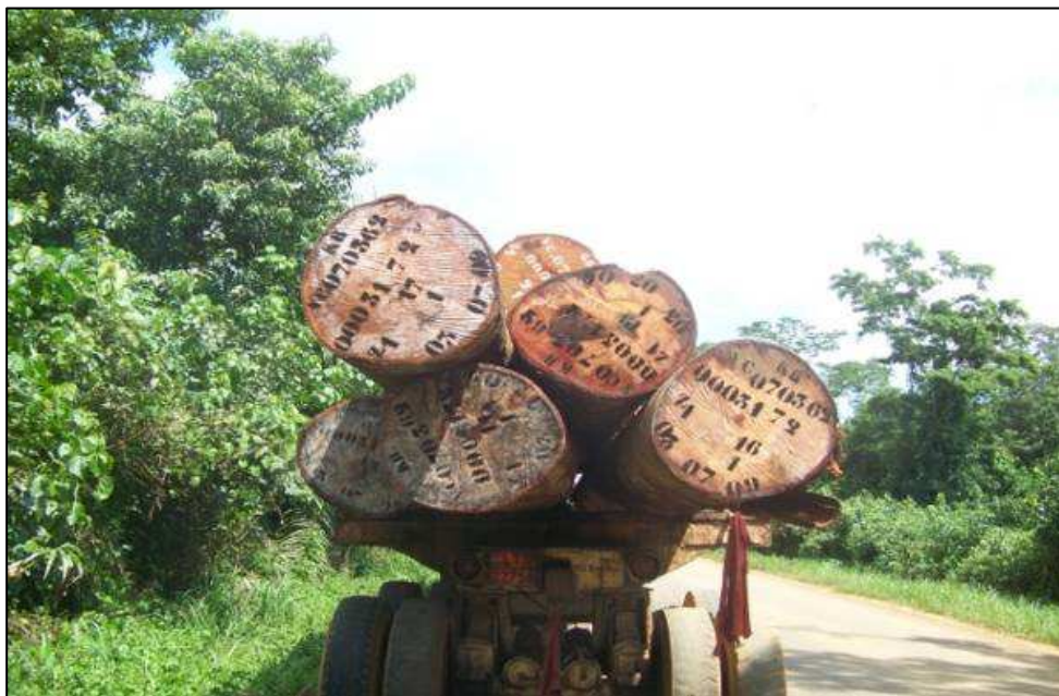
Grumier transportant des billes de bois marquées VC 07 03 62 et sortant du chantier de Somakondo