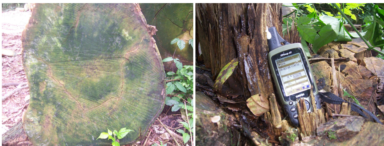
Photos: bois et souche sans marques

L'inspection des parcs à bois, le parcours de quelques bretelles et pistes de débardage ouvertes dans le cadre de la coupe de récupération a permis de dénombrer plus d'une centaine de grumes parmi lesquelles certaines ne portant pas de marques. Plusieurs souches étaient dépourvues de marques réglementaires (nom du titre, numéro de la grume, date d'abattage) prévues par la loi, ainsi que le montre les photos suivantes: